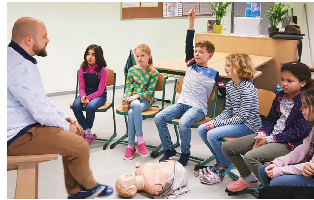
hemmter, als wird das von Erwachsenen kennen.“

Um mit einer kleinen Gruppe intensiv arbeiten zu können, wurden die Viertklässler in Gruppen unterteilt. Zwei Gruppen betreute der Schulpatenarzt selbst, die beiden anderen übernahm sein Kollege, den er für den Einsatz an der Gemeinschaftsschule gewonnen hatte. Darüber hinaus probten die Kinder mit den Ärzten in Rollenspielen, wie sie sich in Notfallsituationen richtig verhalten und wie sie einen Notruf absetzen. „Alle waren begeistert dabei und haben ihre Sache sehr gut gemacht“, lobt der Mediziner. „Viele Kinder waren dabei unge-