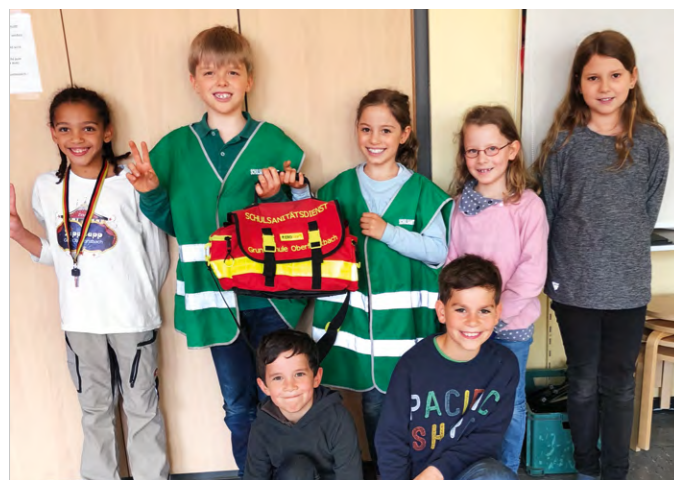
Mit aufs Foto? Na klar! Auf die Schulsanitäter in ihren Reihen sind alle Kinder der Klasse mächtig stolz.