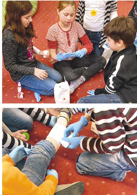
Im Ernstfall sicher sind, was zu tun ist, und keine Hemmungen haben, die Notfallnummer anzurufen, sind die Kinder immer konzentriert.